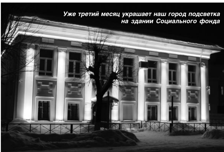
Уже третий месяц украшает наш город подсветка на здании Социального фонда

Разноцветные огоньки гирлянд светятся почти из каждого окна, а в этом и чувствуется приближение праздника. Торговые точки города уже нарядились в праздничное убранство. На городской площади скоро появится красавица ёлка - всеобщая любимица жителей и гостей города. И как мы узнали в Администрации Любимского района, предположительно планируется установить праздничное освещение на 13 объектах. Скоро, скоро Новый год, ждём его с нетерпением и надеждами на лучшее!